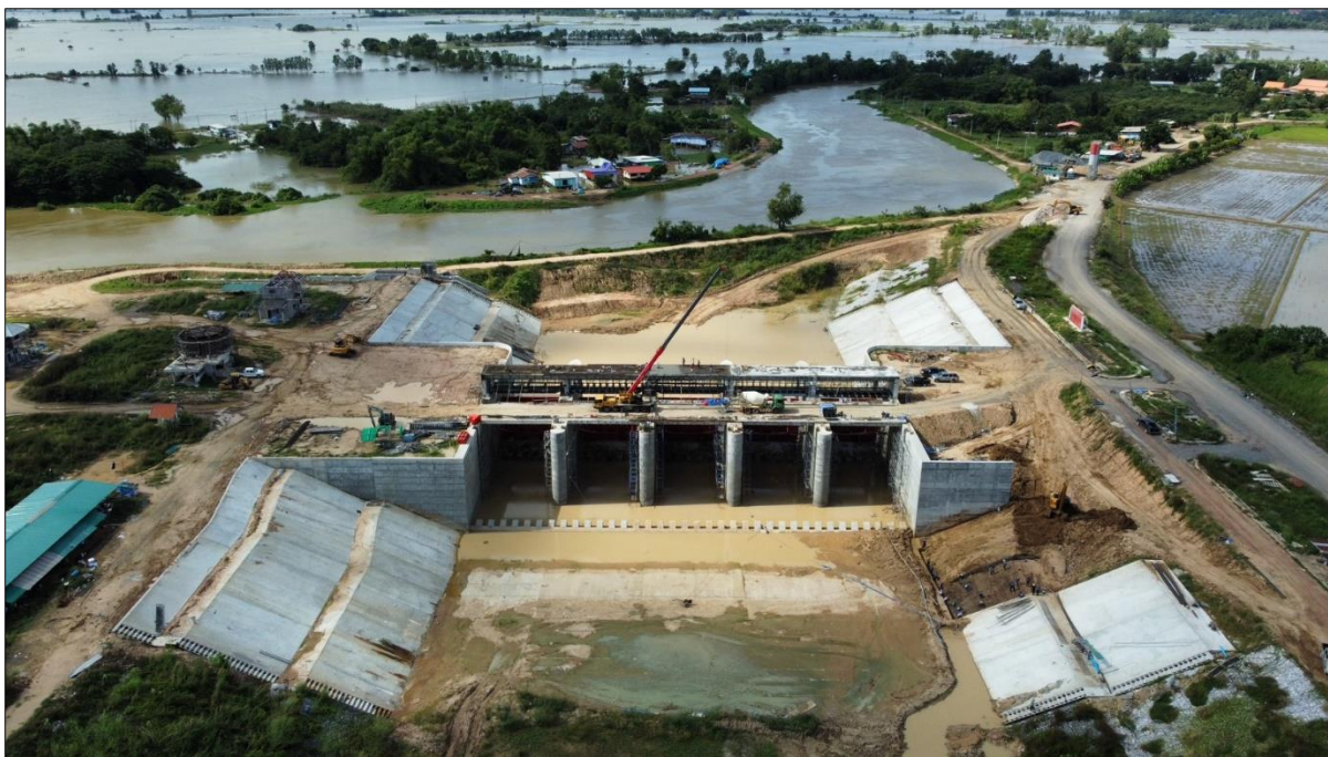
ภาพที่ 1.9-1 การก่อสร้างประตูระบายน้ำห้วยนาง และอาคารประกอบ